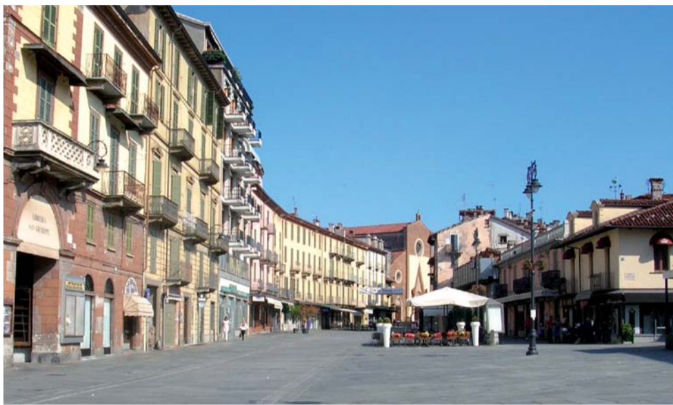
Intervento di riqualificazione urbana

per illustrare la pianificazione commerciale del nostro territorio, è emerso che la programmazione decennale ha dato risultati positivi nel contrastare il fenomeno della desertificazione commerciale e il deficit di servizi soprattutto nelle aree caratterizzate dai piccoli comuni. Gli interventi regionali hanno contribuito alla riqualificazione e al rilancio turistico del territorio e hanno restituito ai cittadini molti centri storici, rendendoli più fruibili e vivibili. Per consolidare le politiche di riqualificazione del commercio urbano è in fase di attivazione una misura specifica che riguarderà per la prima volta le città con oltre 100 mila abitanti, vale a dire Torino e Novara.