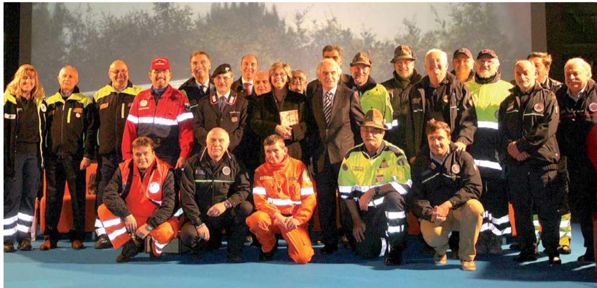
Gruppo dei volontari premiati dalla Regione

vorare in sinergia con altre realtà regionali. «Abbiamo celebrato oggi non solo l'apoteosi del "buon cuore" e della solidarietà sociale - ha dichiarato l'assessore regionale alla Protezione Civile, Luigi Ricca -, ma anche l'aspetto del volontariato organizzato ed efficiente, che è frutto di formazione ed aggiornamento continuo, che è sostenuto da dotazioni di mezzi