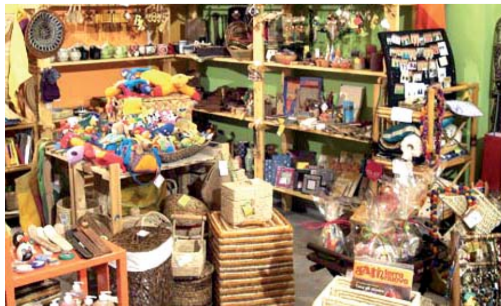
Bottega del commercio equo e solidale

fondamentale svolto dalle organizzazioni operanti in Piemonte per agevolare le relazioni commerciali fra i produttori del Sud del mondo e i consumatori piemontesi restituendo così dignità ai produttori più poveri ed alleviandone le condizioni di svantaggio».