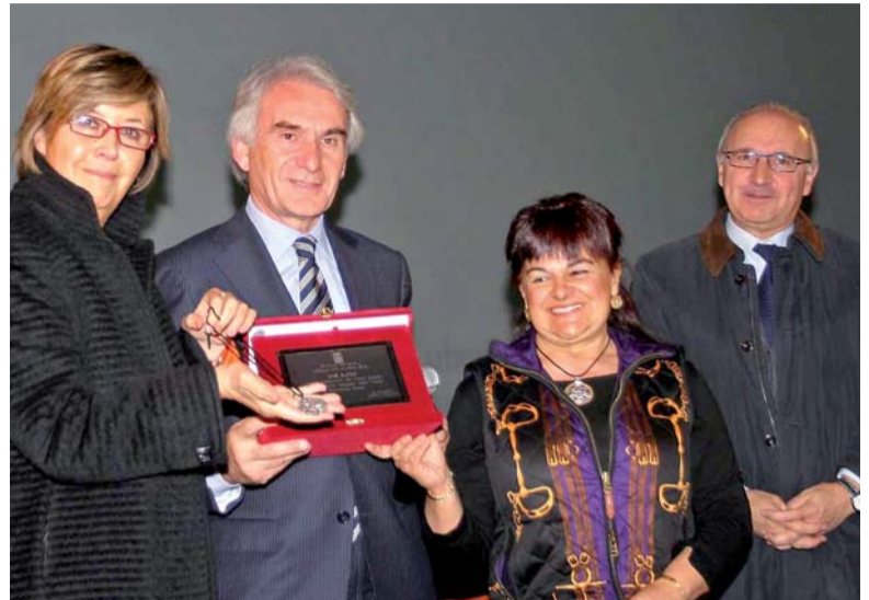
La Presidente Mercedes Bresso, l'Assessore regionale Luigi Ricca, la Presidente della Provincia dell'Aquila Stefania Pezzopane e il Presidente della Provincia di Torino Antonio Saitta

durante l'alluvione del 22 ottobre 2008, le due campagne antincendi boschivi in Puglia e in Liguria, 2008-2009, la massiccia presenza in Abruzzo dal 6 aprile 2009, senza dimenticare la contemporanea presenza sul territorio piemontese per fronteggiare le criticità ambientali, ha permesso al sistema di Protezione civile di testare diverse situazioni la struttura, la logistica e anche la capacità di la-