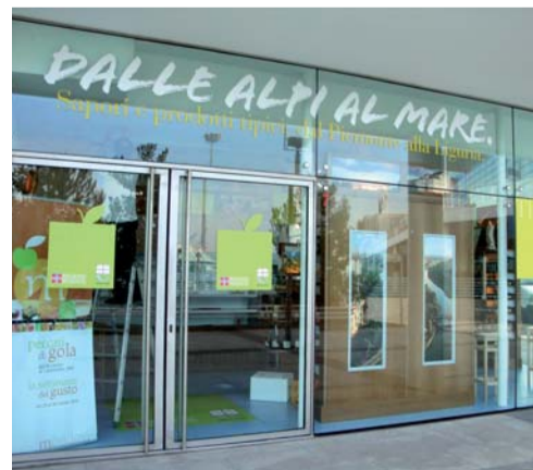
Vetrina dei prodotti piemontesi

munità locali, i consorzi di tutela dei marchi e le associazioni di produttori. «Dalle Alpi al Mare - prosegue l'assessore Ricca - è la seconda vetrina dopo quella aperta due anni fa a Mondovì, all'interno del centro commerciale "Mondovicino" che ha già dato buoni risultati sia in termini commerciali che di promozione dei prodotti tipici. Questa postazione ligure diventa un riferimento per i gourmet di tutto il mondo ed il nostro biglietto da visita sul mare».