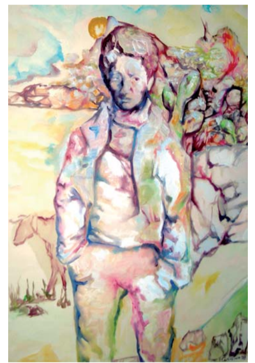
Opera di Francesco Caracciolo